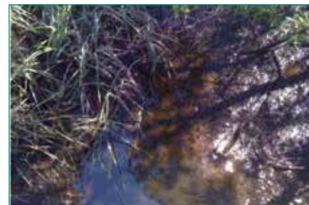
Figura 11: El arroyo contiguo también muestra los beneficios del tratamiento.