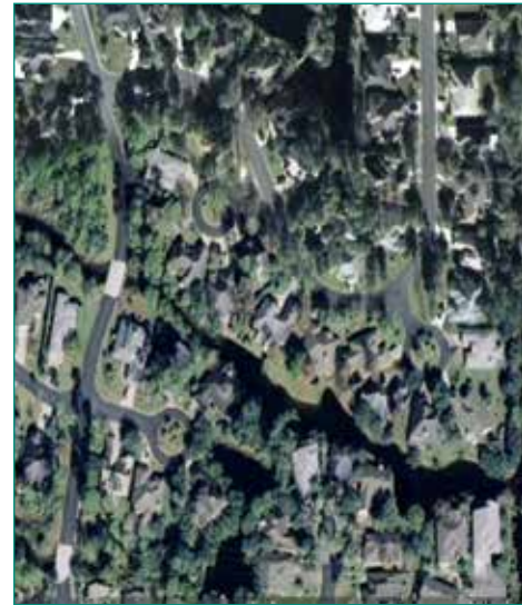
Figura 12: Visita aérea del Lago #4 y el arroyo que lo alimenta.

Este lago de 1 acre lo alimenta un arroyo dependiendo de las mareas del Canal Intracostero. Es un lago elongado donde el arroyo pasa por debajo de las secciones blancas en la imagen aérea. Hay un buen caudal que va del estuario al Canal Intracostero.