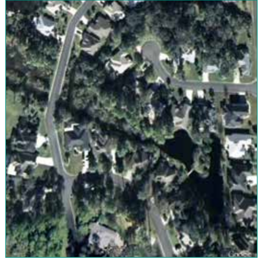
Figura 16: Las imágenes de abajo a la izquierda son antes del tratamiento y muestran capa residual, turbidez y residuos, los cuales ya no aparecen en las imágenes de la derecha, tomadas después del tratamiento.

Figura 15: A la derecha de la vista aérea es posible ver el lago y la conexión con el Canal Intracostero.