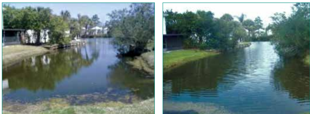
Figura 8: Más imágenes del "antes" (izquierda) y "después" (derecha) del Lago #2.