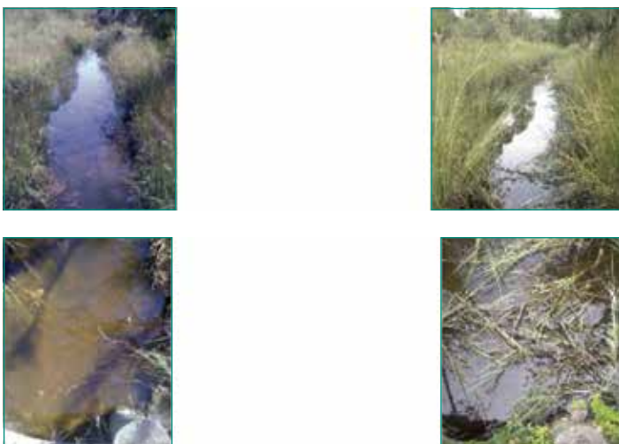
Figura 18: Además, las imágenes del arroyo asociado con la Laguna 5 muestran que incrementó la claridad del agua después del tratamiento (derecha) en comparación con las imágenes antes del tratamiento (izquierda). El principal beneficio fue la reducción de los sólidos de fondo, lo cual causaba la turbidez durante su degradación.