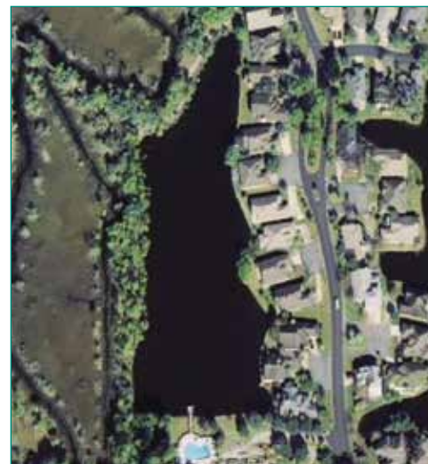
Figura 3: Vista aérea del Lago #1

Este lago de 2 acres con un aliviadero hacia el Canal Intracostero conectado por dos alcantarillas con dispositivos antirretorno en caso de tormentas. Aunque crecía una población sana de plantas naturales en el costado sudoeste del lago, había erosión a lo largo de toda la orilla oeste del lago. Había una carga moderada de nutrientes proveniente del mantenimiento a los céspedes, escorrentía y detritos naturales. Este lago tenía un historial de floraciones moderadas de algas.