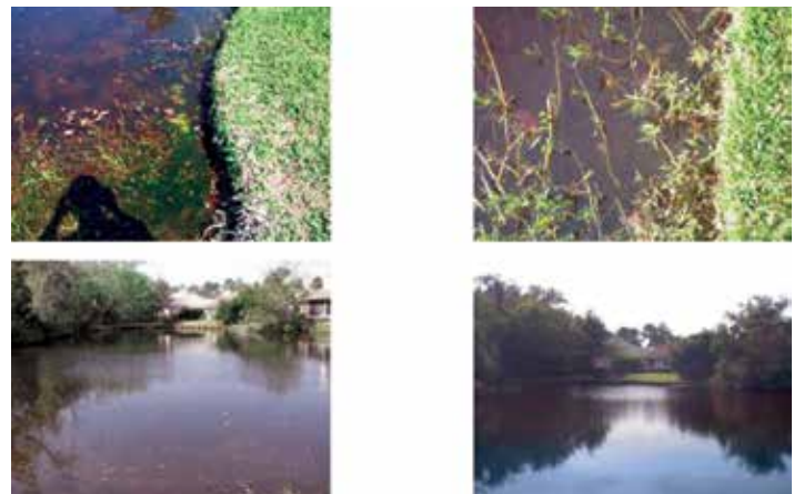
Figura 20: Las imágenes demuestran una mejora en la superficie y claridad del agua.

Es interesante señalar que la tecnología MICROBE-LIFT® fue capaz de remediar todos los siete lagos a pesar del influjo serio de agua de mar y la escorrentía de químicos dañinos, incluyendo fertilizantes y plaguicidas del mantenimiento del césped y jardín de las casas aledañas. La reducción de los sólidos de fondo con MICROBE-LIFT® ayuda a restaurar las capacidades naturales y bioaumentadores restaurativos de cuerpos de agua, permitiendo la reducción de la dosis de mantenimiento en una remediación continua.