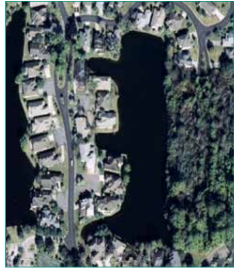
Figura 6: Vista aérea del lago #2.

El Lago #2 es un lago de 2 acres conectado al Lago #1 mediante una alcantarilla. Una carga pesada de nutrientes provenientes del mantenimiento del césped, escorrentía, detritos naturales y construcciones en la ribera oriente había degradado la calidad del agua. No hay Canal Intracostero.