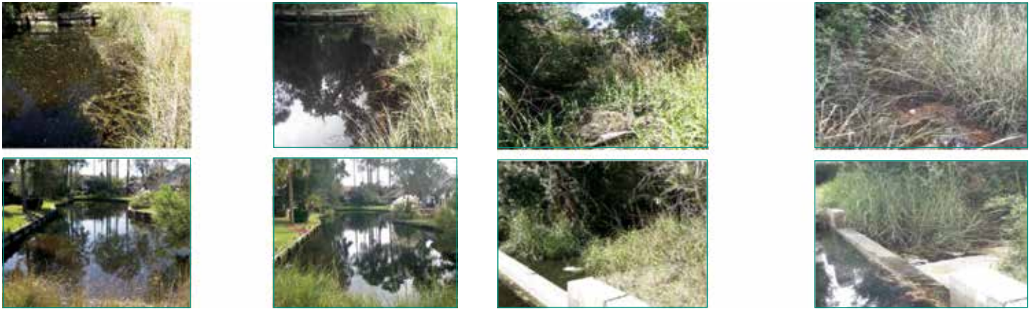
Figura 17: Imágenes del arroyo "antes" (izquierda) y "después" (derecha).

Figura 16: Las imágenes de abajo a la izquierda son antes del tratamiento y muestran capa residual, turbidez y residuos, los cuales ya no aparecen en las imágenes de la derecha, tomadas después del tratamiento.