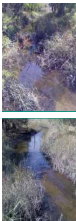
Figura 14: El arroyo también respondió al tratamiento, exhibiendo menos capa residual y un aumento dramático en la claridad del agua.