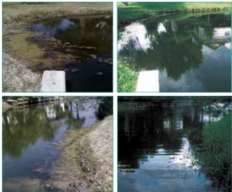
Figura 7: Según las imágenes de "antes" (izquierda) y "después" (derecha) del tratamiento, los tratamientos con MICROBE-LIFT® fueron muy exitosos en el Lago #2.