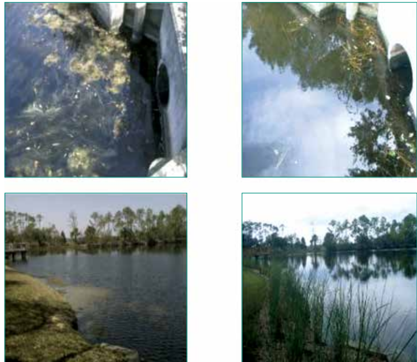
Figura 5: Estas imágenes de la izquierda muestran la capa de algas antes del tratamiento y las imágenes de la derecha muestran el agua transparente sin alga como resultado del tratamiento con MICROBE-LIFT®. Esta es la orilla sur del lago #1.