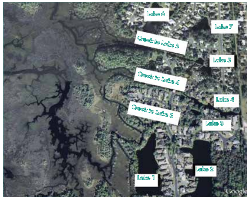
Figura 2: Vista aérea de la propiedad mostrando todos los lagos a ser tratados, la ubicación de las casas y la relación con el Canal Intracostero.

La siguiente imagen muestra la ubicación de los lagos y las casas. El lago número dos fue el primer lago tratado y hay fotos de "antes" (febrero 2009) y "después" (octubre 2009), a ocho meses de diferencia.