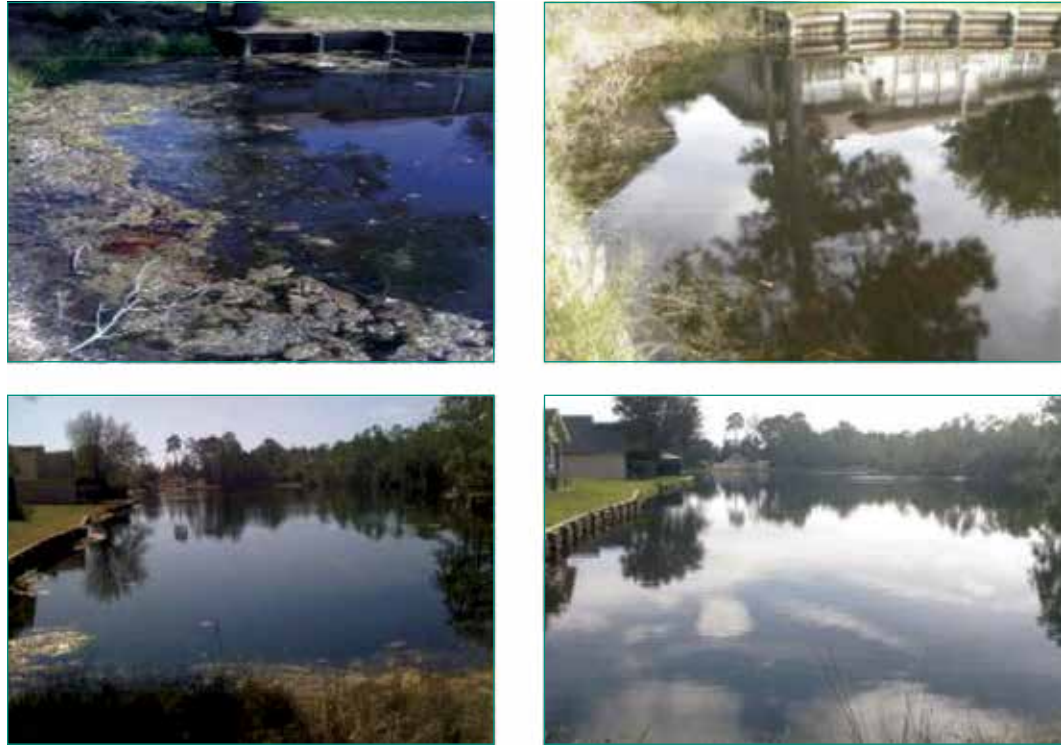
Figura 4: A la izquierda están las imágenes antes del tratamiento y a la derecha, las imágenes después del tratamiento. Estas son vistas de la orilla norte del Lago #1. La capa de algas en las imágenes de la izquierda se eliminó por completo.

Las imágenes de abajo muestran las condiciones del Lago #1 antes y después del tratamiento. El primer grupo de imágenes muestra la orilla norte del lago.