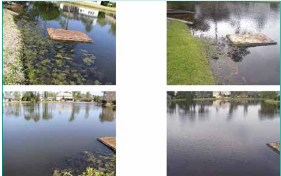
Figura 19: Nótese la capa residual sobre el lago sin tratamiento (imágenes de la izquierda), la cual se redujo o eliminó dramáticamente con el tratamiento (derecha).

El Lago 6 mide 1.5 acres y tiene un aliviadero que fluye hacia un arroyo que estaba totalmente obstruido por la acumulación de sólidos de fondo con crecimiento de vegetación. Este lago recibe una carga moderada proveniente del mantenimiento del césped, escorrentía de nutrientes y detritos naturales.