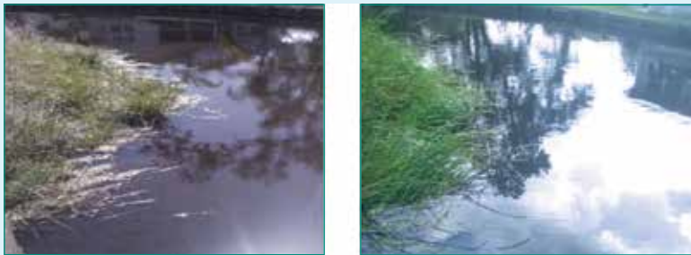
Figura 13: Imágenes de "antes" y "después" del tratamiento del Lago #4. Las imágenes del "antes" en la izquierda muestran la capa residual visible, pero en las imágenes de "después" a la derecha se puede observar que la capa residual ha desaparecido y el agua está significativamente más clara. También se redujeron los sólidos de fondo.